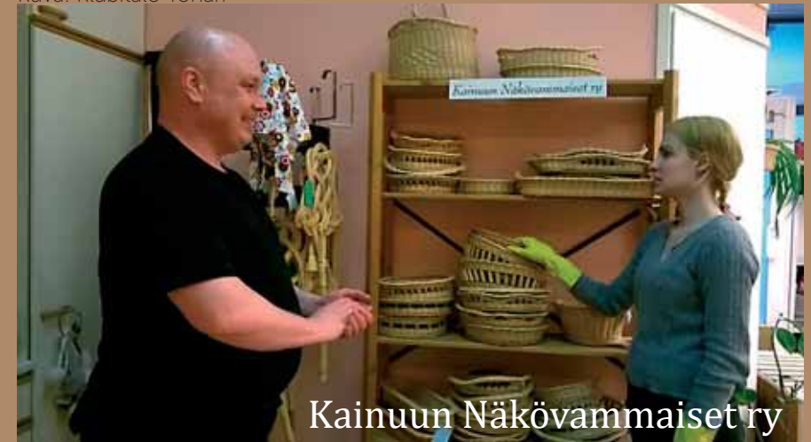
Kainuun Näkövammaiset ry