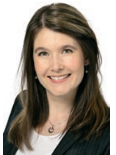
TEKSTI: Johanna Karimäki kansanedustaja (vihr) VAMYT-ryhmän puheenjohtaja

Kevään aikana VAMYT-ryhmä on tavannut useita eri vammaisjärjestöjen edustajia ja keskustellut ajankohtaisista vammaispoliittisista ongelmista. Meillä on yhdessä vielä paljon tehtävää, jotta vammaisten ihmisten työllistyminen parane ja täysimääräinen osallistuminen yhteiskuntaan helppottuu.